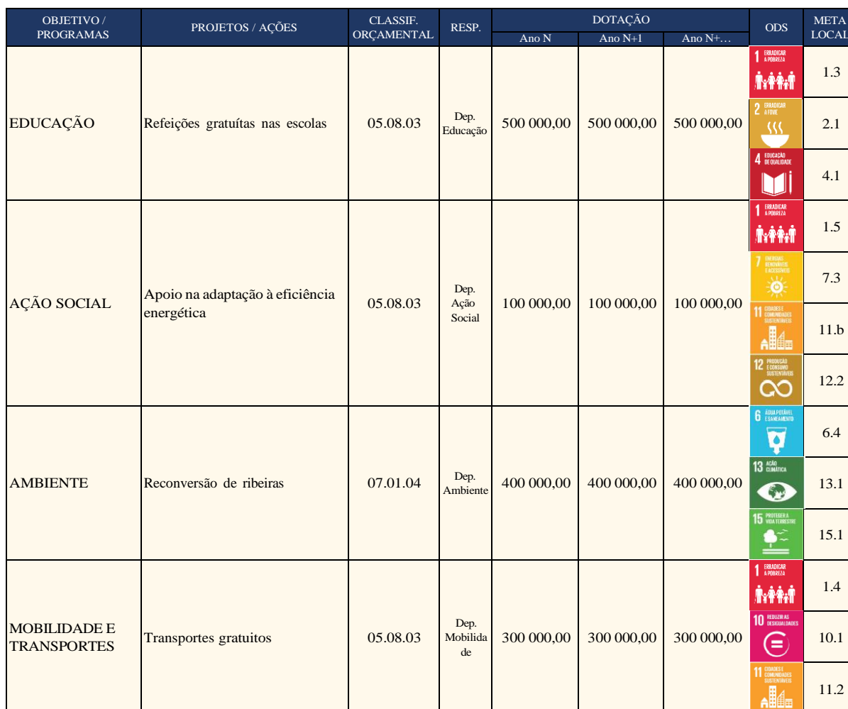
Figura 2: Exemplo de marcação dos ODS no orçamento municipal

Apesar da sua simplicidade, este modelo pode ser uma solução prática para municípios com práticas e capacidades de governança menos avançadas ou que não procuram implementar de imediato reformas mais abrangentes. É um modelo que não provoca mudanças significativas nos processos orçamentais existentes, mas permitirá aos governos locais entenderem um pouco melhor o alinhamento dos recursos orçamentais com os ODS.